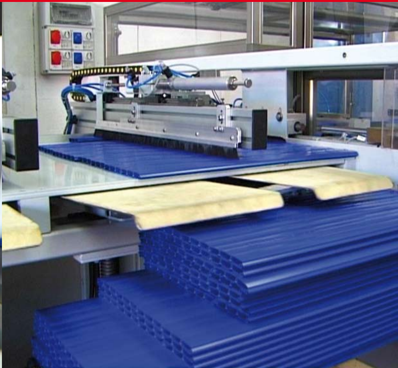
Dettaglio del banco di confezionamento Detail of the assembly table