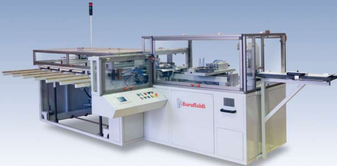
C1/P-7 Bracci mobili · C1/P-7 Mobile arms