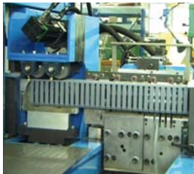
Canaletta punzonata e gruppo di traino Punched duct and transport group