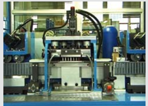
Punzonatrice verticale Vertical punching head