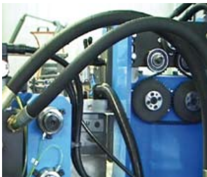
Gruppo di traino e testa orizzontale Transport group and horizontal head

Thanks to the modularity criteria with which we design these systems each plant is customised according to the specific production needs of the customer.